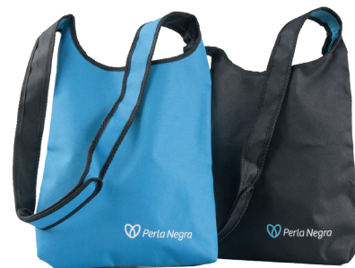
Código EST0177 BOLSO MORRAL $20.000