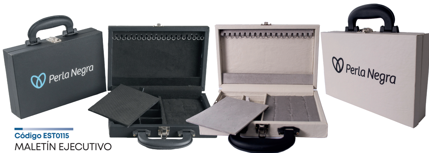
Código EST0115 MALETÍN EJECUTIVO $43.000