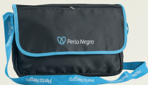
Código EST0152 BOLSO SOLAPA $17.000