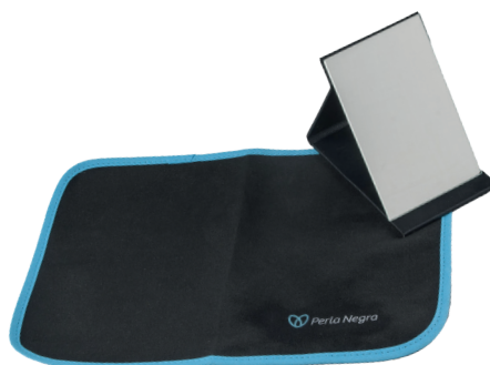
Código EST0106 KIT INICIAL PAÑO Y ESPEJO $8.000