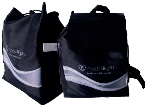
Código EST0194 BOLSO MOCHILA $14.500