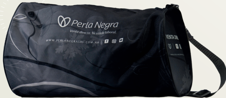
Código EST0212 BOLSO SPORT $19.000