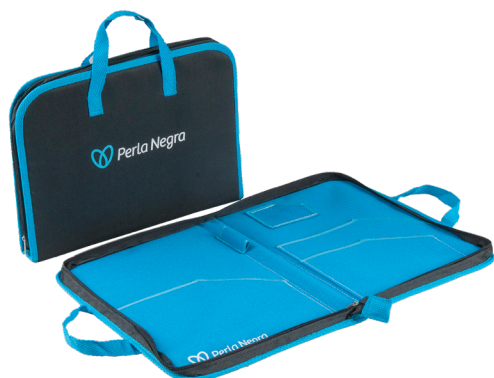
Código EST0153 CARPETA INSTITUCIONAL $12.000