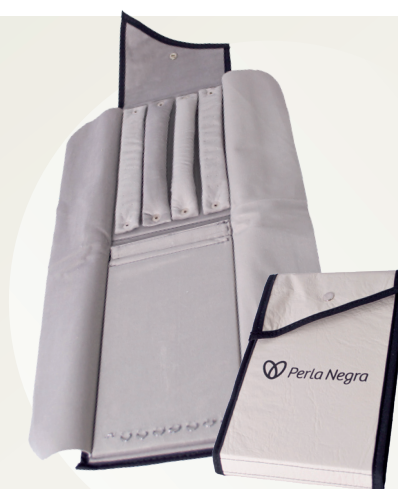
Código EST0108 MALETÍN TOP CLASS PREMIUM $24.000