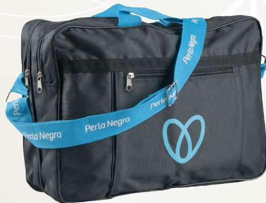
Código EST0159 BOLSO EJECUTIVO DOBLE $25.000