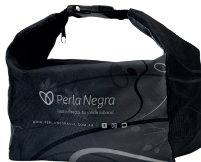
Código EST0213 PORTA ACCESORIOS $16.000