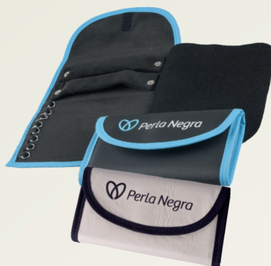
Código EST0040 MALETÍN POCKET $14.500