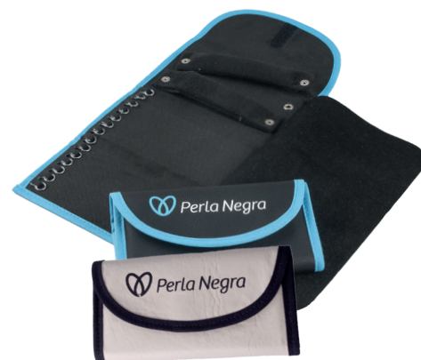
Código EST0041 MALETÍN POCKET MEDIUM $16.000