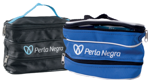
Código EST0154 NECESER DOBLE $6.000