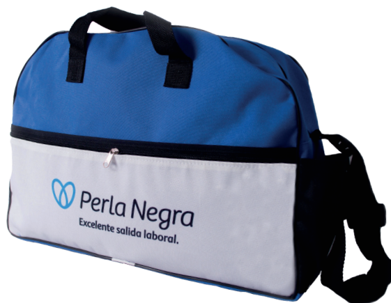
Código EST0197 BOLSO DEPORTIVO $17.500